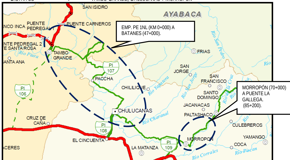
Imagen N° 02 – plano Ruta PI 107 - Tambo Grande - Batanes y Morropón – Puente la Gallega.

REGIÓN : PIURA PROVINCIAS : PIURA, MORROPÓN DISTRITOS : TAMBO GRANDE, CHULUCANAS Y MORROPÓN