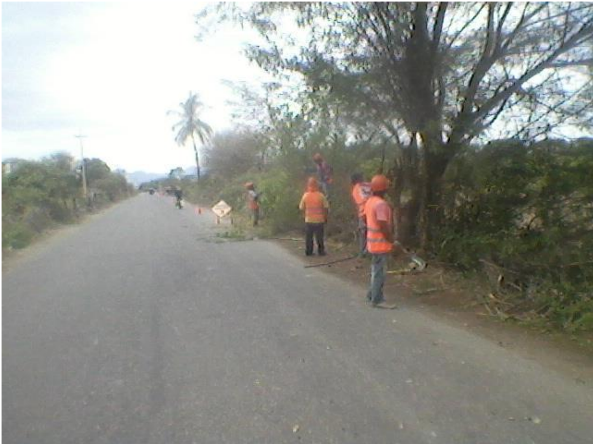
Foto N° 2: Se observan los trabajos de desbroce y limpieza de vegetación.