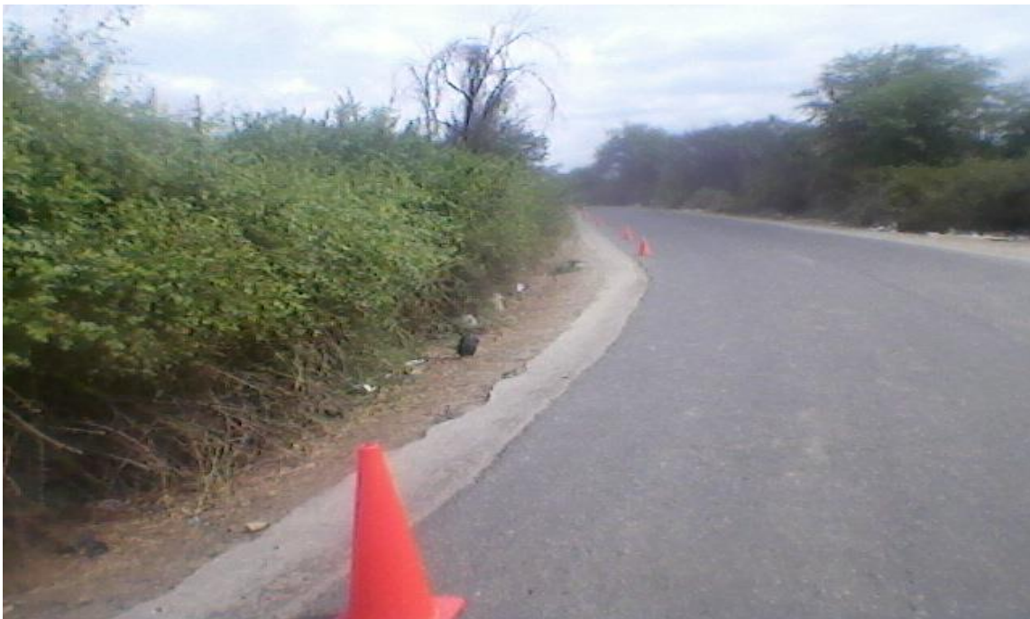
Foto N° 3: Se continúa con los trabajos de desbroce y limpieza de vegetación